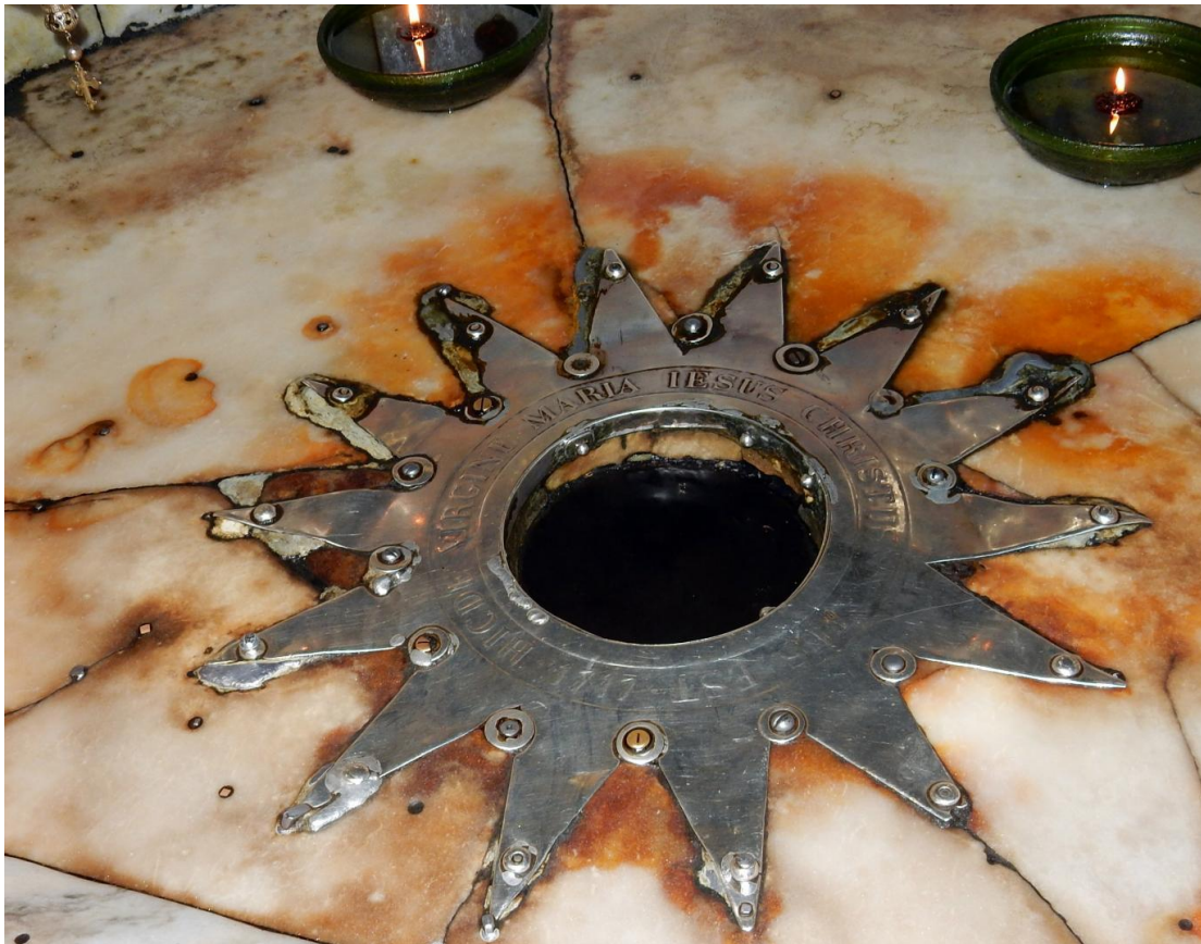
Stern in der Grotte der Geburtskirche Jesu in Bethlehem